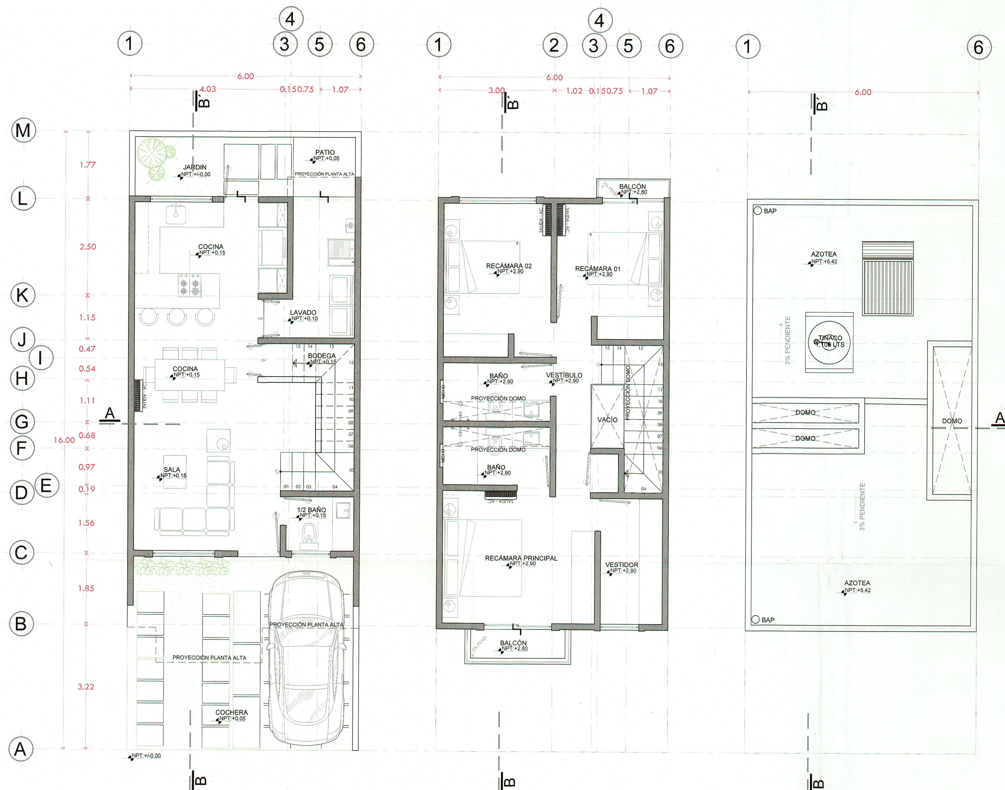
Planta Baja arquitectónico