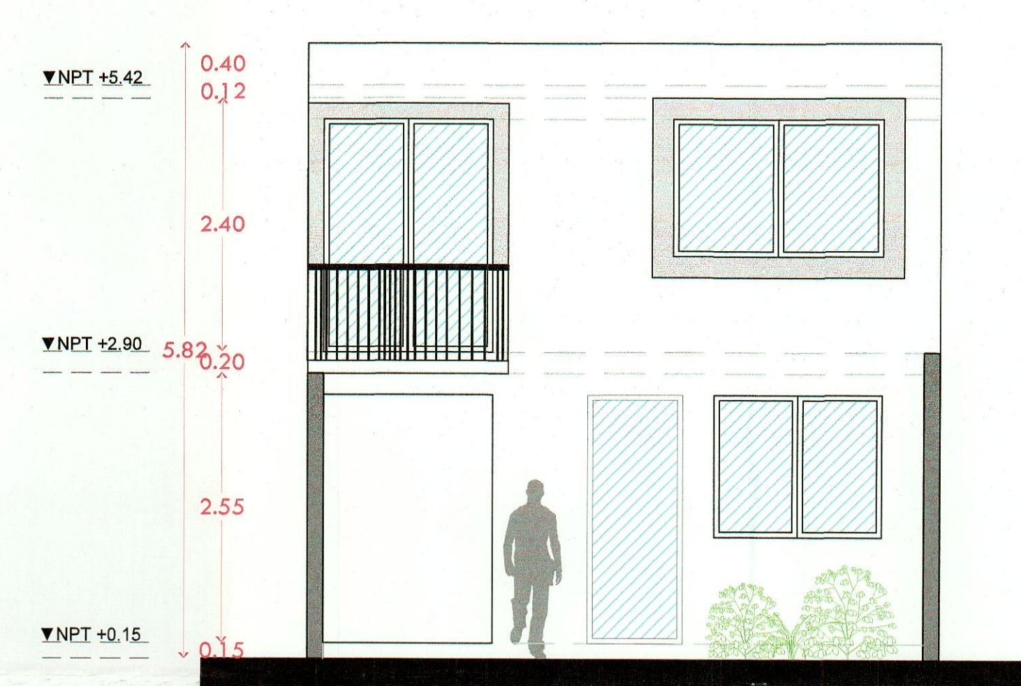
Fachada posterior arquitectónico