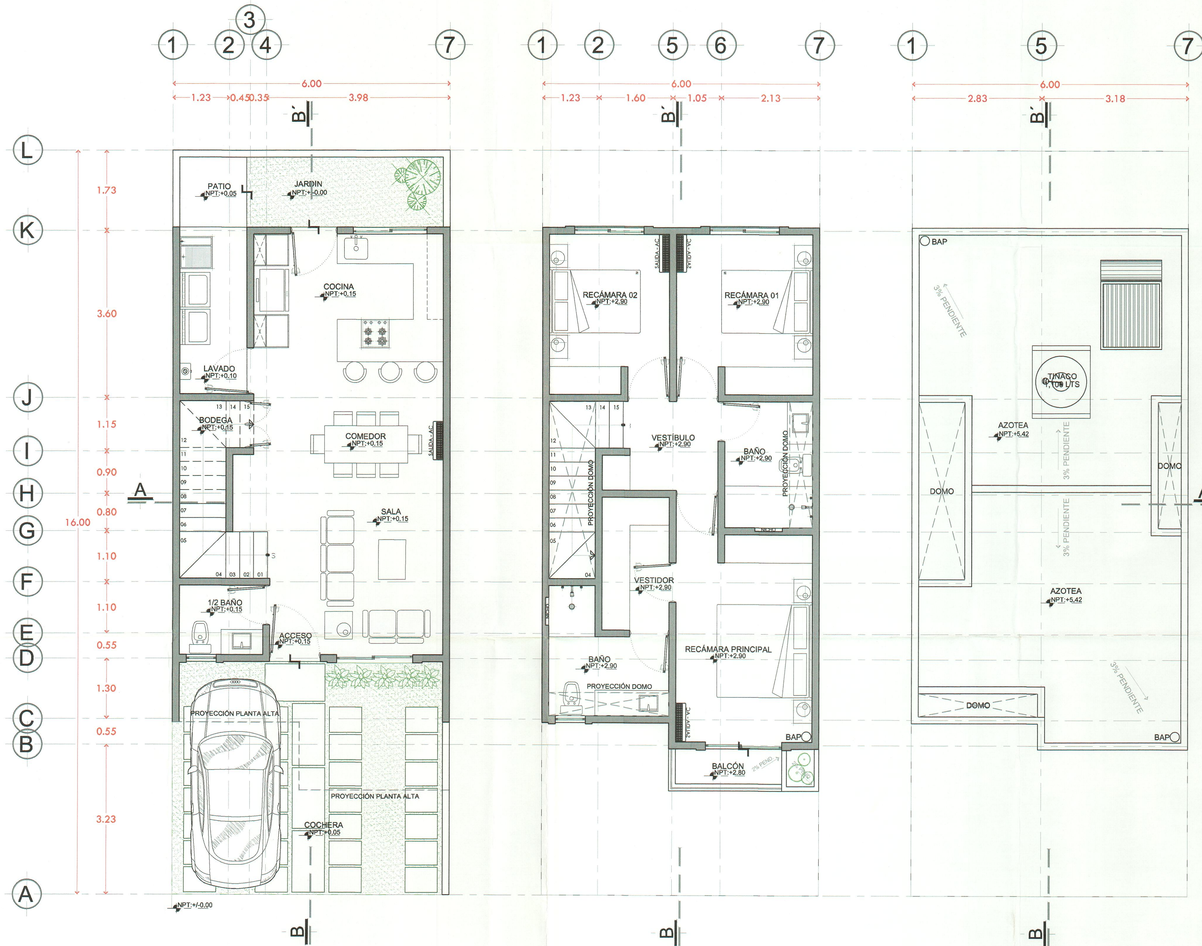
Planta Baja arquitectónico