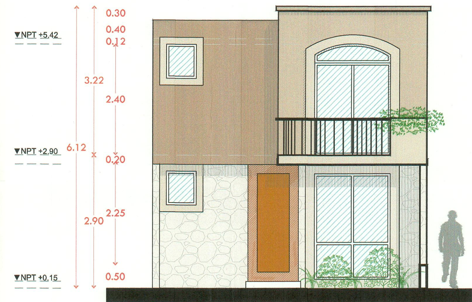
Fachada principal arquitectónico