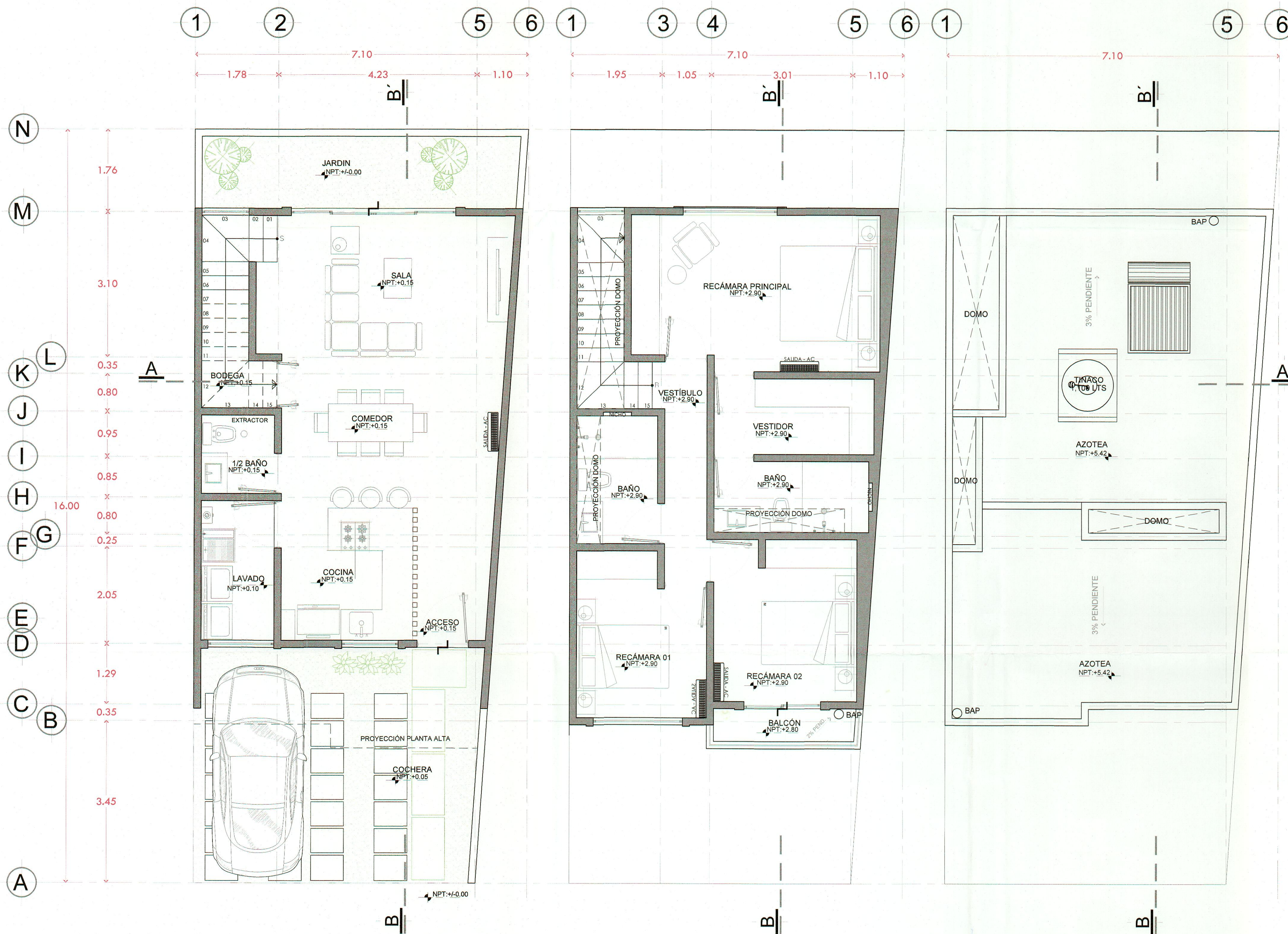
Planta Baja arquitectónico 74.44 M2