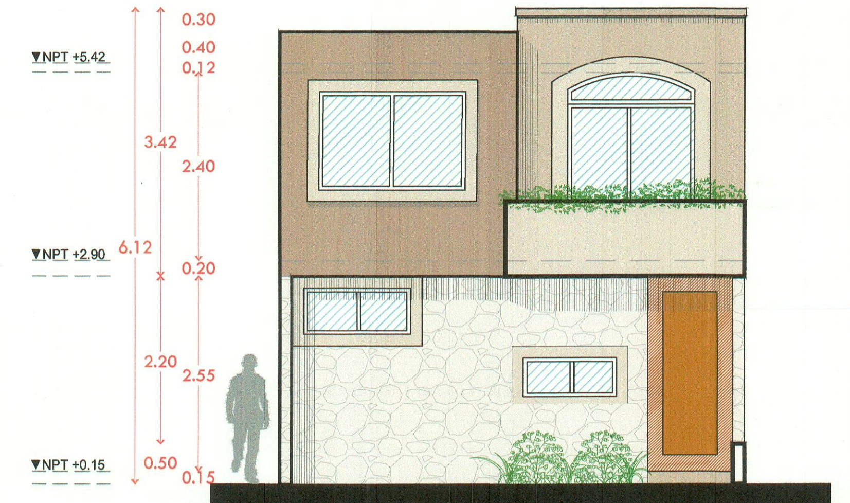
Fachada principal arquitectónico